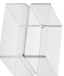
Flash 10 cestino 20 x 20 x 8 Flash 10 basket