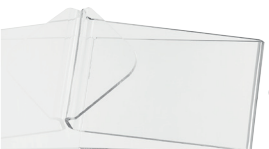
Flash 12 portadepliant 15 x 8 x 21 Flash 12 leaflet holder